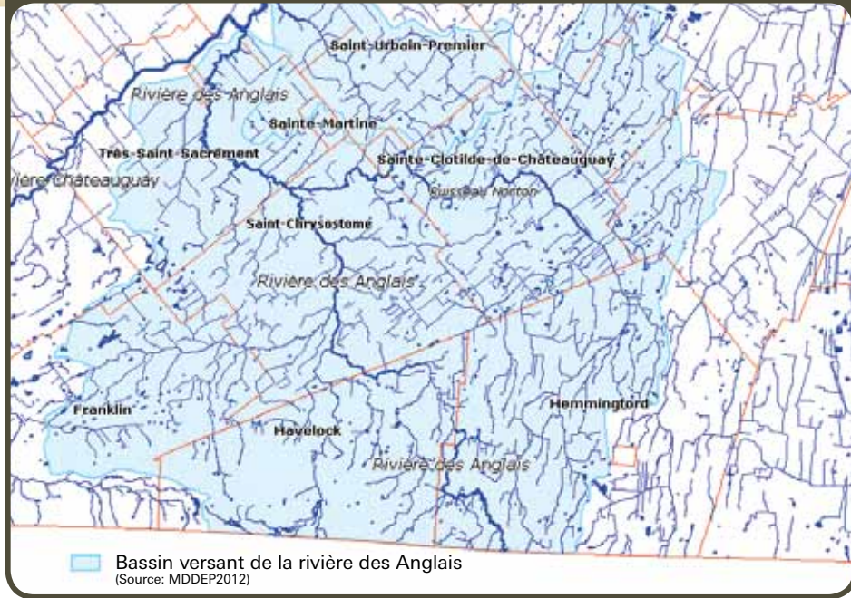
Bassin versant de la rivière des Anglais

» CE PROJET EST IMPORTANT, CAR IL N'EXISTE AUCUNE AIRE PROTÉGÉE EN MILIEU PRIVÉ SUR CE TERRITOIRE. POURTANT, CE TERRITOIRE EST À PLUS DE 95% DE TENURE PRIVÉE. IL Y EXISTE UNE GRANDE BIODIVERSITÉ DE LA FAUNE ET DE LA FLORE.