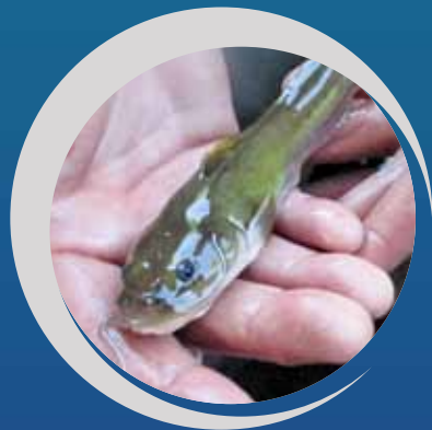
Barbotte des rapides