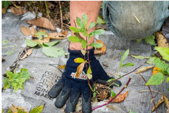
Plantations en milieu agricole pour stopper l'érosion des terres agricoles